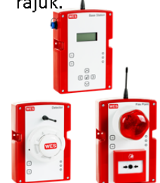
Példamegoldás a 183 férőhelyes ACI Marina Milna-ban (Hotvátó.), *a füstérzékelők kiosztása csak jelképes

A WES+ vezeték nélküli mobil tűzjelző és evakuációs rendszer forgalmazója a High Security Kft.