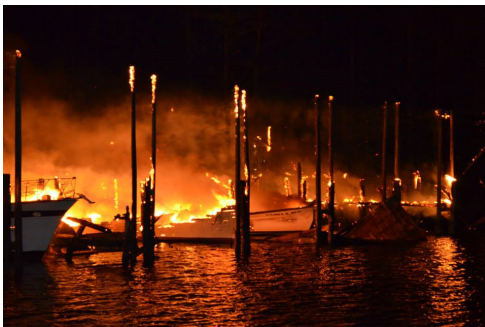
Port Kinsale 2015.01.09.

Nem csak a hajón való főzés, dohányzás, de számos elektromos fogyasztó is könnyen okozhat tüzet. Elég, ha csak arra gondolunk, hogy hűvösebb időben a hajókon bizony előkerülnek a mobil hőszugárzók is.