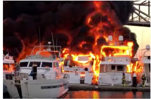
Port Forum Barcelona, 2017.04.09

A legtöbb vitorlás és jacht kikötőben százas nagyságrendű az állandó hajóhelyek száma. Az éppen nem használt hajók "saját" kikötőjükben várják az újabb indulást, vagy sokszor szállásként funkcionálnak két túra között. A kikötői helyek természetesen nagy értéket jelentenek, így a hajók szorosan egymás mellett helyezkednek el, növelve a kockázatot. Egy vitorlásra vagy jachtra számos okból alakulhat ki tűz, mint ahogy erre a megtörtént tüzesetekből is következtethetünk.